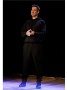
Lisa, de Nicolas Devort, à voir à la Comédie Odéon.

Lisa, jusqu'au 1er juin, tarifs à partir de 13,50 €, Comédie Odéon. 6, rue Grolée, Lyon 2e. 04 78 82 86 30, http://www.comedieodeon.com